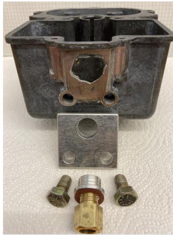
Hugo hat eine passgenaue Aluminiumplatte gefertigt. Diese wurde mit Zwei-Komponentenleim am Vergaser befestigt. Benzinleitung ist neu an dieser Platte verschraubt.