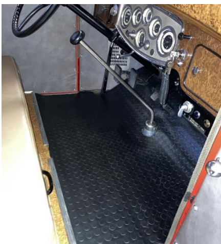
Bodenmatte vorne ersetzt. Die alte war spröde / gerissen.