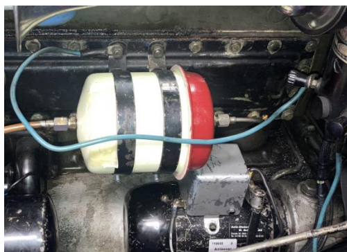
Ölwechsel, Ölfilter ersetzen