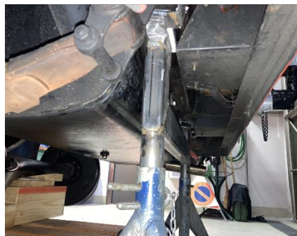
Dani hat eine Konstruktion geschweisst um das Chassis abzustützen, damit die Achse frei hängt.