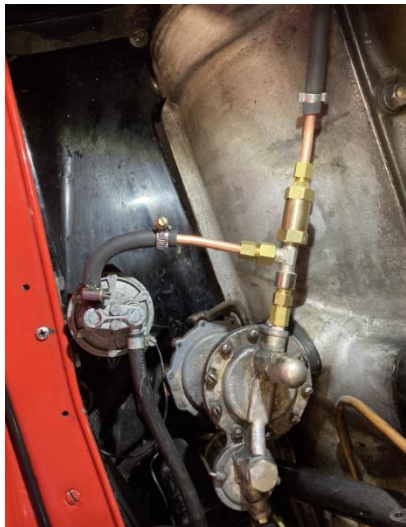
Neue Benzinleitung von der Benzinpumpe zum Vergaser ist mit einem Rückschlagventil versehen.