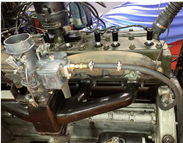
Die neue Benzinleitung ist an der neuen Befestigung angebracht. Der Vergaser ist gereinigt und mit neuen Dichtungen versehen. Reparatursatz für den Vergaser ist immer noch erhältlich.