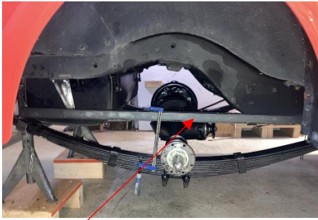
Federn müssen zum Aus- und Einbau gespannt werden, sonst sind sie zu

kurz. Dabei hilft die von Dani konstruierte Stange und Schraubzwingen.