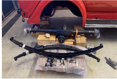
Blattfedern sind zurück und bereit zum Einbau