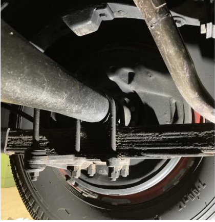
Blattfedern hinten durch Firma Bieri, Stans überprüft und revidieren lassen