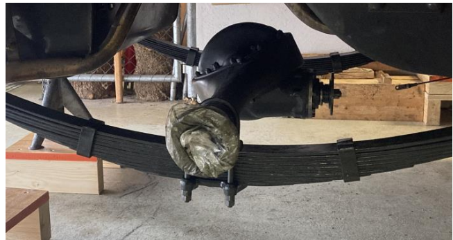
Radlager hinten neu gefettet.