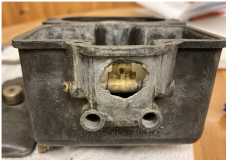
Die Dichtmasse der alten Reparatur war spröde.