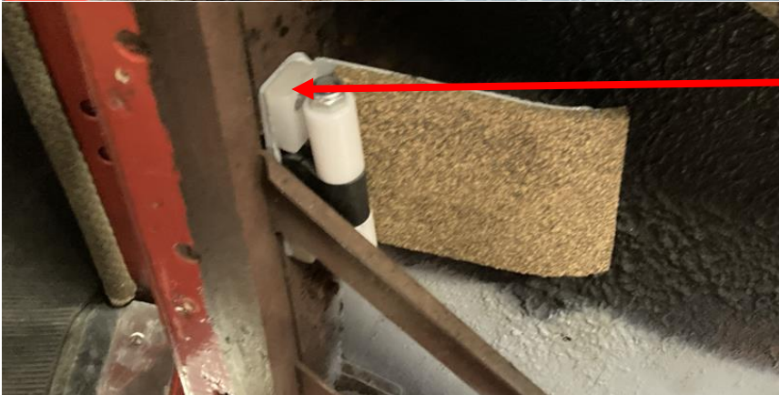
Anschlag in der Türe