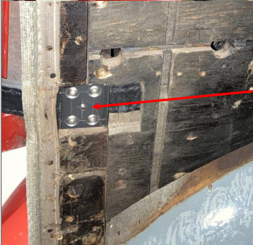
Befestigung an der Innenseite des Türrahmens (hinten)